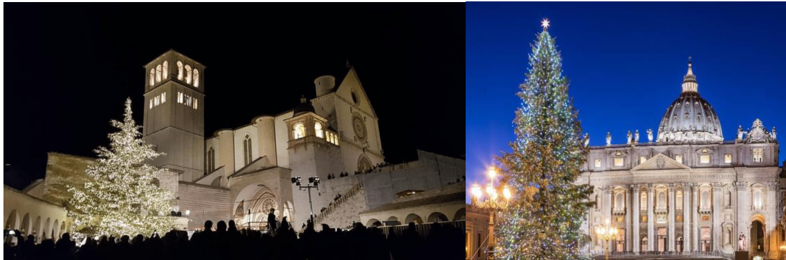
Vues de Noël depuis la basilique Saint-François et la basilique Saint-Pierre